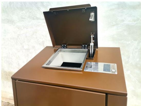
Couvercle avec compas à gaz