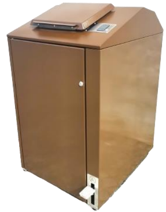
Version avec lecteur avec contrôle d'accès