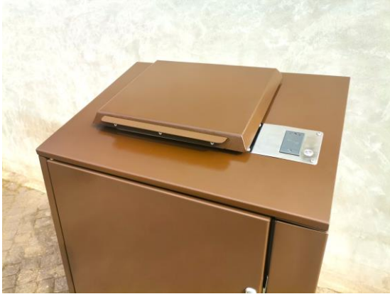
Couvercle avec serrure mécanique