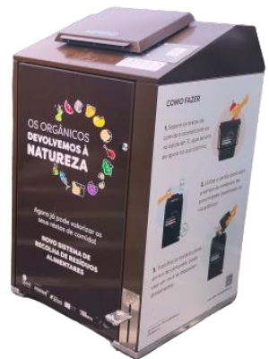
Version stickers personnalisés