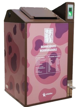
Version stickers personnalisés